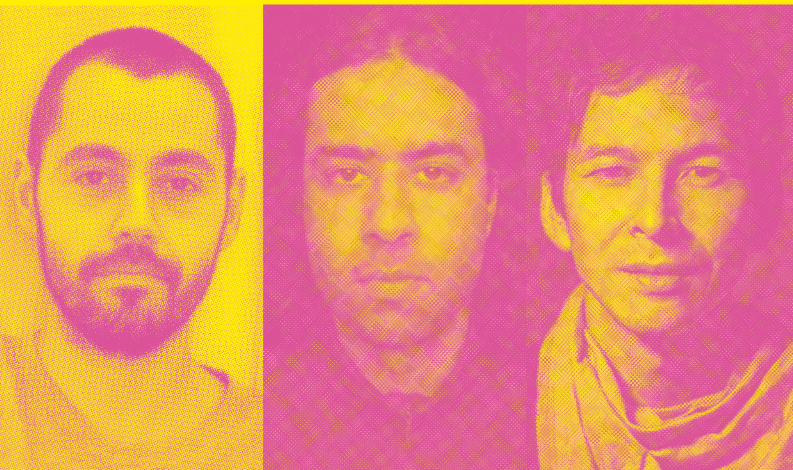
Arkadi Zaidés