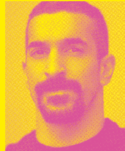
Rauf - RubberLegz - Yasit