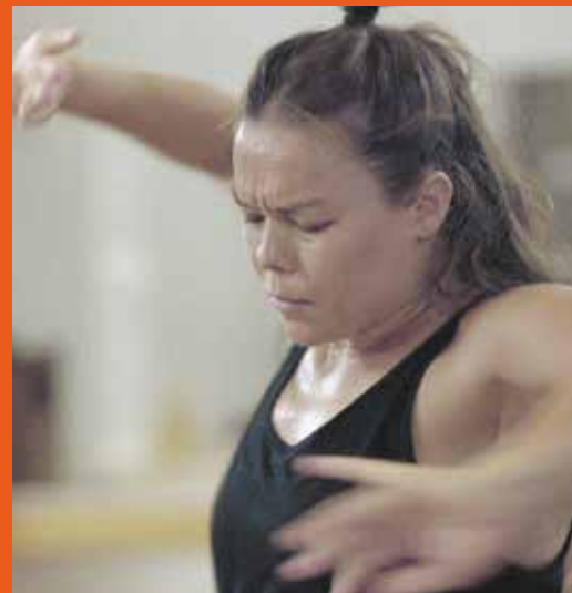
IMPULSO d'Emilio Belmonte

Ce film a reçu le prix du meilleur film de danse par le Syndicat national de la Critique en 2024.