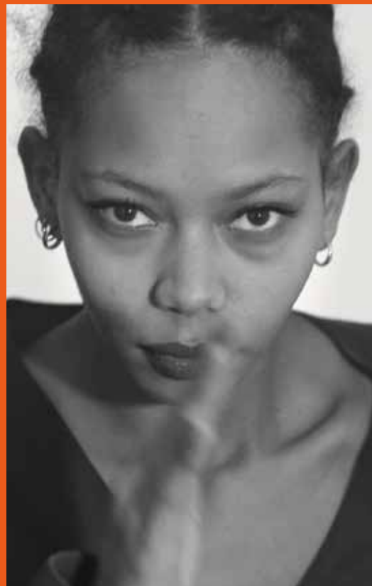
Monstre Magique de Grégoire Korganow