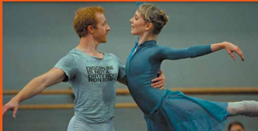
Resilient Man, danser malgré tout de Stéphane Carrel